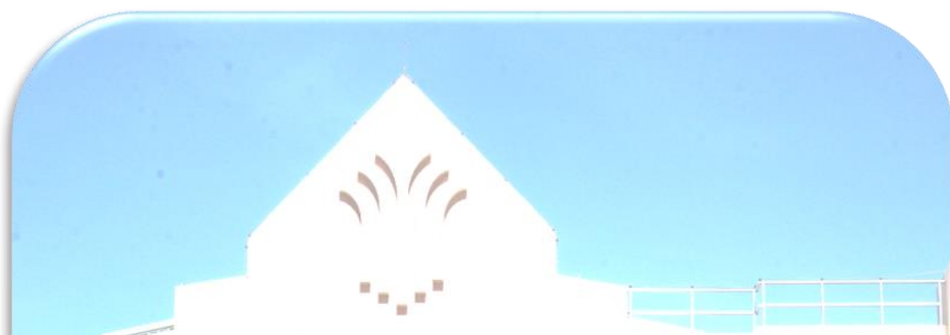
ระเบียบมหาวิทยาลัยนครพนม ว่าด้วยการศึกษาระดับบัณฑิตศึกษา พ.ศ. 2560