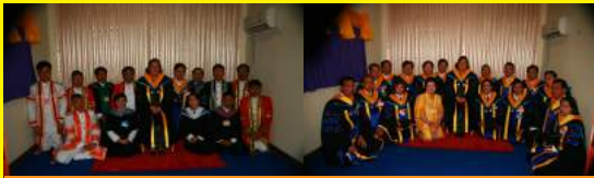
พิธีพระราชทานปริญญาบัตร ครั้งที่ 1 ปีการศึกษา 2548 - 2549 วันอังคารที่ 13 พฤศจิกายน 2550