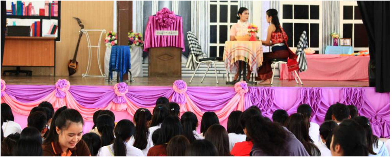
“ภพรัก” ลำดวน ชวนฝัน: ละครเวทีสาขาวิชาภาษาไทย คณะครุศาสตร์ มนพ.

วันที่ 4 ธันวาคม 2560 สาขาวิชาภาษาไทยได้จัดแสดงละครเวทีเรื่อง “ภพรัก” ลำดวน ชวนฝัน ณ บริเวณโรงยิม คณะครุศาสตร์ มหาวิทยาลัยนครพนม โดยนักศึกษาสาขาวิชาภาษาไทยชั้นปีที่ 3 ซึ่งเป็นผลผลิตจากการเรียนการสอนในรายวิชา “วรรณกรรมบทละคร” กิจกรรมนี้นักศึกษาได้ใช้ความรู้ด้านภาษาและวรรณกรรม โดยนำปรับใช้เพื่อใช้ในการเขียนบทละคร ทั้งนี้ นักศึกษา ยังได้เรียนรู้และฝึกปฏิบัติจริงจากกิจกรรมนี้