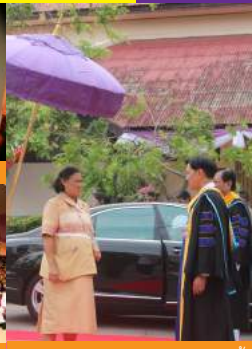
พิธีพระราชทานปริญญาบัตร ครั้งที่ 3 ปีการศึกษา 2552 - 2553 วันพุธที่ 3 เมษายน 2556