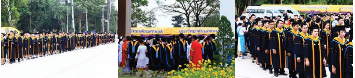
พิธีพระราชทานปริญญาบัตร ประจำปีการศึกษา 2559 มหาวิทยาลัยนครพนม

วันที่ 13 ธันวาคม 2560 ที่ผ่านมา มหาวิทยาลัยนครพนมได้จัดพิธีรับพระราชทานปริญญาบัตร ประจำปีการศึกษา 2559 วันที่ 13 ธันวาคม 2560 ณ อาคารศรีโคตรบูรณ วิทยาลัยการทองเที่ยวและอุตสาหกรรมบริการ มหาวิทยาลัยนครพนม