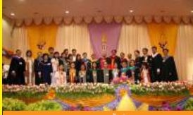
พิธีพระราชทานปริญญาบัตร ครั้งที่ 2 ปีการศึกษา 2550 - 2551 วันอังคารที่ 16 มิถุนายน 2552