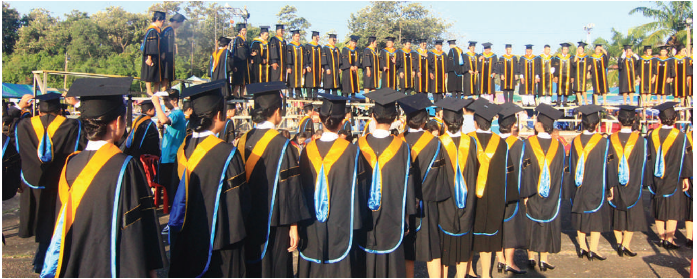
บัณฑิตและมหาบัณฑิต คณะครุศาสตร์ มนพ. ซ้อมรับพระราชทานปริญญาบัตร ประจำปีการศึกษา 2559

วันที่ 11 ธันวาคม 2560 ที่ผ่านมา บัณฑิตและมหาบัณฑิต คณะครุศาสตร์ ได้เข้าร่วมพิธีการซ้อมรับพระราชทานปริญญาบัตร ประจำปีการศึกษา 2559 ในวันซ้อมใหญ่ ณ อาคารศรีโคตรบูรณ วิทยาลัยการทองเที่ยวและอุตสาหกรรมบริการ มหาวิทยาลัยนครพนม