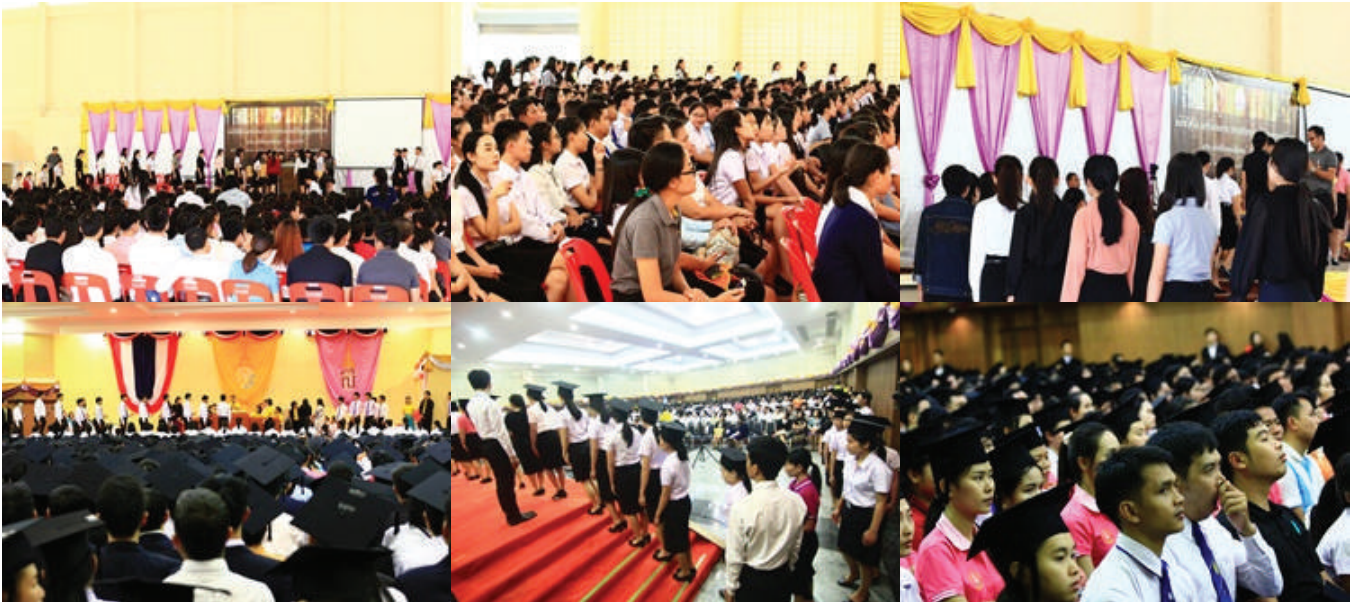
คณะครุศาสตร์ มนพ. ได้จัดพิธีการต้อนรับพระราชทานปริญญาบัตร ประจำปีการศึกษา 2559

วันที่ 4 ธันวาคม 2560 สาขาวิชาภาษาไทยได้จัดแสดงละครเวทีเรื่อง “ภพรัก” ลำดวน ชวนฝัน ณ บริเวณโรงยิม คณะครุศาสตร์ มหาวิทยาลัยนครพนม โดยนักศึกษาสาขาวิชาภาษาไทยชั้นปีที่ 3 ซึ่งเป็นผลผลิตจากการเรียนการสอนในรายวิชา “วรรณกรรมบทละคร” กิจกรรมนี้นักศึกษาได้ใช้ความรู้ด้านภาษาและวรรณกรรม โดยนำปรับใช้เพื่อใช้ในการเขียนบทละคร ทั้งนี้ นักศึกษา ยังได้เรียนรู้และฝึกปฏิบัติจริงจากกิจกรรมนี้